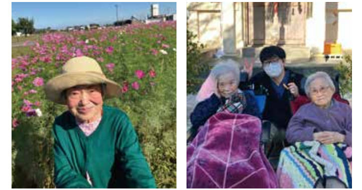
季節ごとにお出かけレクリエーションやイベントを行ない、これまでの習慣をたいせつにしたいと、「ここにしかない自由度の高い暮らし」を実現しています。

もちろん個別レクや個別リハだけではなく、リビングで行なわれるグループ体操やおやつ作りなどの集団レクも行なっています。何をするか自分で選べる自由度の高い暮らしは、心身の健康にも好影響が出ているようです。看多機が併設されているので医療ニーズの高い方へも柔軟に対応。介護度や医療依存度の程度に関わらず、その方に合わせた対応力の幅広さは『ブランヴィル野方』の強みです。