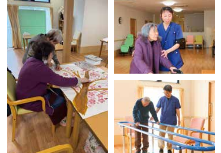
デイサービスがお休みの日でも、リビングで他のご入居様と交流されたり、スタッフと一緒にリハビリに取り組んだり、思いおもいに自由な時間を過ごしていただいています。